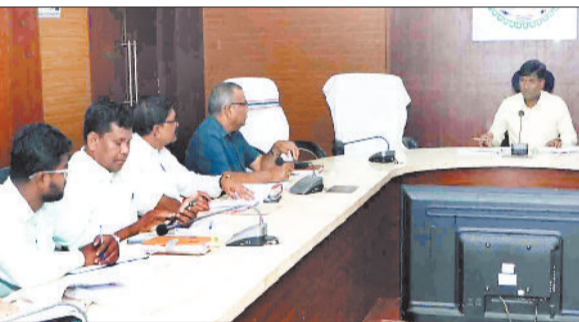
बैठक को संबोधित करते कलेक्टर।