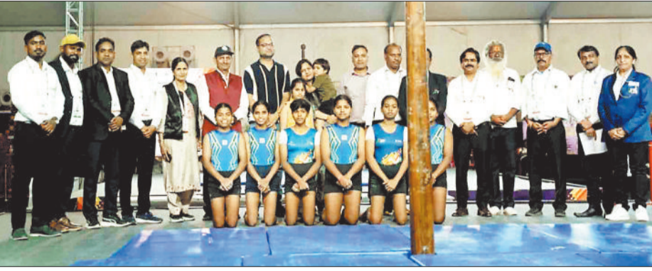
अतिथियों के साथ खिलाड़ी।

हरिभूमि न्यूज ▶▶ विश्रामपुर जिले के विभिन्न क्षेत्रों में कथित रूप से अवैध क्लिनिक संचालित होने और भोले-भाले ग्रामीणों से इलाज के नाम पर मोटी रकम वसूलने के आरोप सामने आ रहे हैं। जानकारी के अनुसार कुछ लोग चांदसी दवाखाना सहित विभिन्न नामों से क्लिनिक संचालित कर हाइड्रोसिल, बवासीर, भगंदर समेत अन्य गुप्त रोगों के शर्तिया इलाज का दावा कर रहे हैं। उक्त दावा आयुर्वेद के आड में प्रशासन की कार्यवाई से बचने दिखावे के लिए किया जा रहा है। आरोप है कि इन क्लिनिकों का संचालन करने वाले कथित